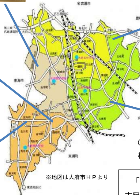
※地図は大府市HPより