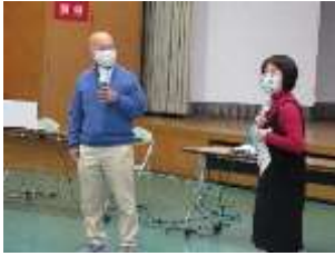
性別役割分担意識は 夫婦の日常にもいっぱい。

1月22日（金）レディースカレッジ&メンズカレッジの合同講座 「地域の活躍人に聞く・地域活動から得るもの」にて、ミューぷらん・おおぶの理事が講義を行いました。