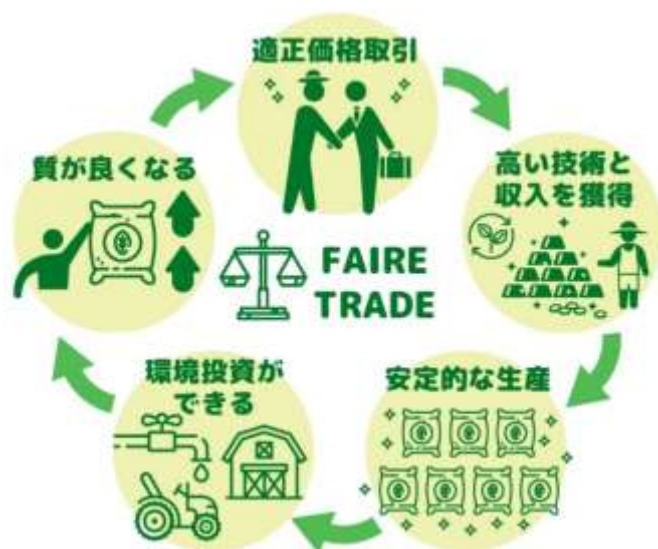
フェアトレードイメージ図

フェアトレードとは途上国の経済的社会的に弱い立場にある生産者と経済的社会的に強い立場にある先進国の消費者が対等な立場で行う貿易です。適正な賃金の支払いや労働環境の整備などを通して生産者の生活向上を図ることが第一の目的です。