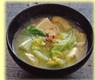
参照：書籍「粗食」のきほんより

キャベツには豊富なビタミンと胃の粘膜を修復し肝臓の機能を回復する効果もあります!