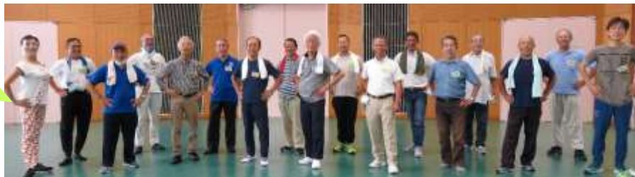
メンズカレッジ ウォーキング講座での記念写真！ みなさん10歳若返ったかな？