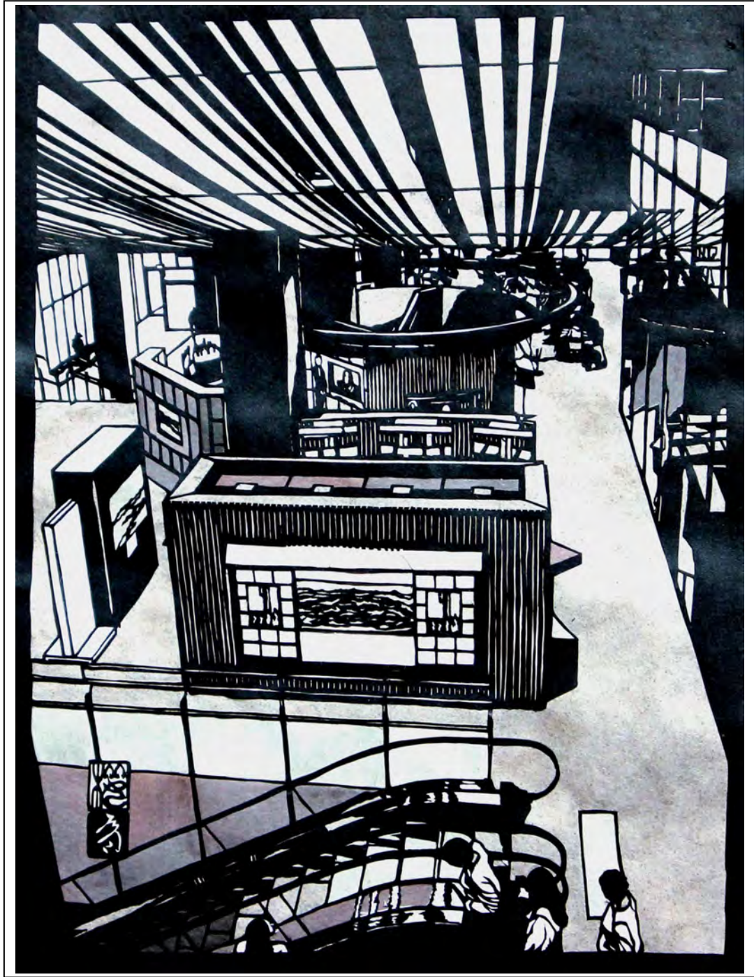
(東海市芸術劇場 2F・嚶鳴広場)