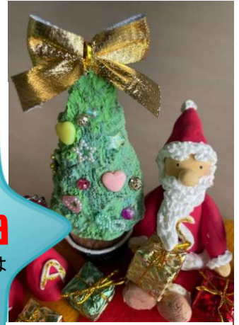
↑粘土で作ろう!のイメージ

申し込み及び 問い合わせ先 上野公民館 : 9時～20時 (上野公民館休館日を除く) 電 話 : 052-603-0304