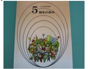
【記念誌：大人の学校同窓会5周年の歩み】

この4月に同窓会発足5周年記念事業を行い、記念誌を発行しました。記念誌は市民活動室に置いてありますので、欲しい方は受付へどうぞ。