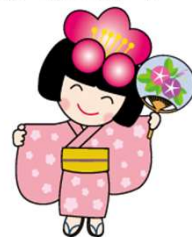
佐布里池 梅まつりキャラクター梅子

※講師陣は弁護士・地域包括支援センター職員など各分野の専門職をそろえております。 都合により、テーマが他日程と入れ変わる場合があります。 体調不良や発熱等症状がある場合は、来校をお控えください。