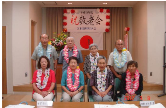
ご長寿おめでとうございます。 敬老の日にあたり、私たちの先輩である皆様方に対し、感謝いたします。いつまでもお元気で町内会を見守ってくださいますよう、お願いいたします。

40名の参加者による敬老祝賀会が、杉山公会堂において盛大に行われました。 明愛幼稚園児の歌と遊戯(カワイイとの声)、フラダンス、子ども会の歌と鍵盤ハーモニカ、祭ばやし、カラオケ、あつと言う間の楽しいひと時でした。 いつまでも元気で来年も皆さんに出席していただけたらと思います。