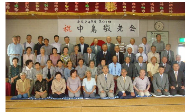
9月17日(日)に開催しました。 雨の中にもかかわらず、多くの方に参加していただくことができました。