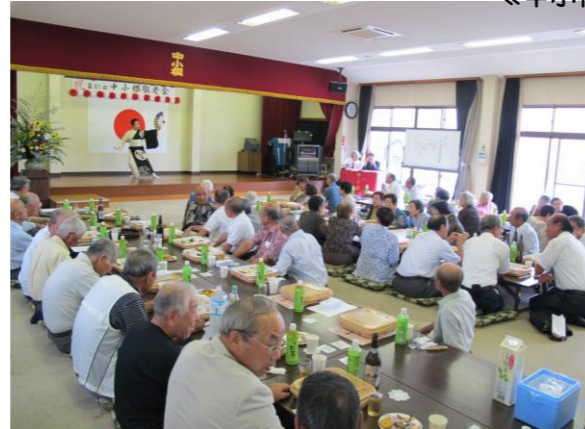
今年は48名の方に出席していただきました。 大正琴、カラオケなど大いに楽しんだ後、最後の大抽選会では豪華景品に大変盛り上がりました。