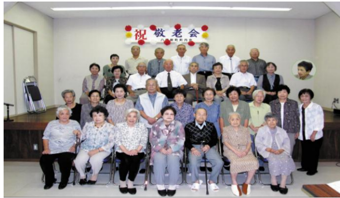
平成24年度 八幡新町敬老会 9月16日 八幡新町集会所 また来年もお元気な姿でおいでくださいますように。 (スタッフ一同)