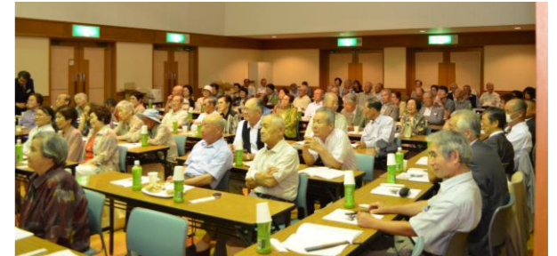
9月9日(日)青少年会館での荒古敬老会に60余名の方が参加され、久しぶりの顔に話も弾みました。余興を堪能し抽選会では一喜一憂するなど、楽しいひと時でした。