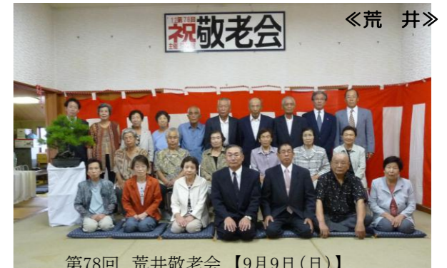
第78回 荒井敬老会【9月9日(日)】 荒井地区の75歳以上の高齢者を対象に、敬老会を開催しました。 アトラクションではオカリナの演奏に合わせて歌を口ずさむ方もあり、楽しいひと時を過ごしました。