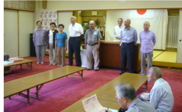
本年度の式典の最後は、75歳になられた8名の方が前に出たところで名前を紹介し、代表者に挨拶をお願いしました。 新会員は、先輩会員から温かく迎え入れていただきました。