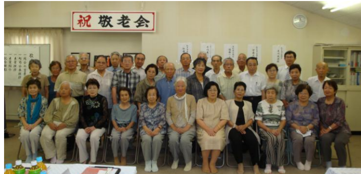
皆さん、いい顔していました。ますますお元気です!!