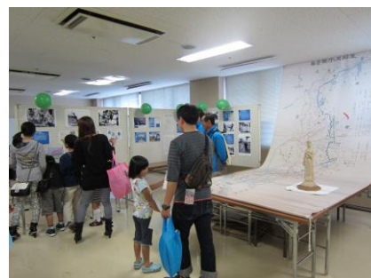
大勢の来場者でにぎわう会場