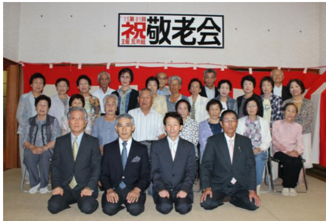
いつまでも若々しいみなさんです。