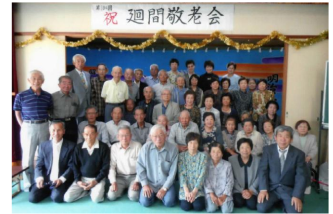
9月21日(月)第104回廻間敬老会を開催し、名物となった「延命うどん」が大好評で、ますます長生きできます。