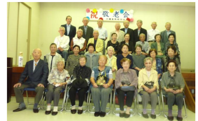
まだまだ元気で、ボランティアによる余興も楽しんでおられました。