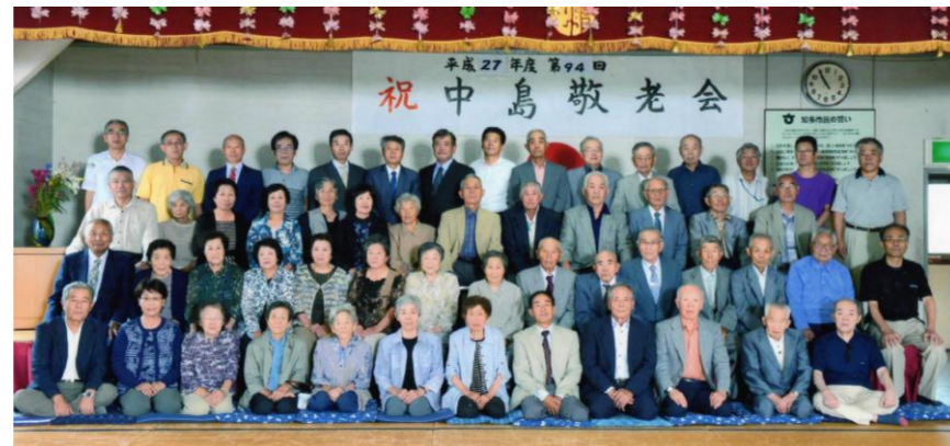
今年も元気に勢ぞろい。