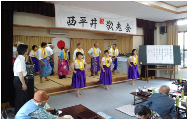
アロハダンスで老人も青年に！