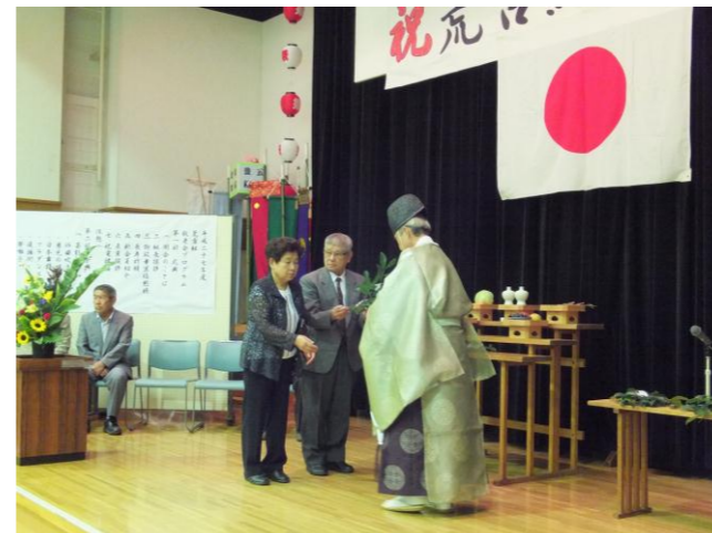
敬老会代表長寿祈願