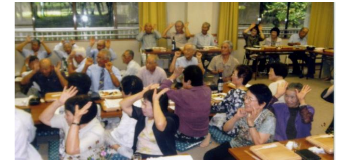
元気の秘訣は体を動かすことです。