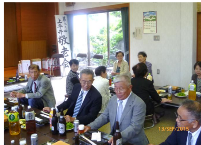
ヴァイオリン・フルートの生の演奏をバックに、みんなで思い出の歌をうたいました。

「敬老の日」は国民の祝日の一つ。「多年にわたり社会につくしてきた老人を敬愛し、長寿を祝う」と法律に定められています。当初は、昭和二九年から「としよりの日」と称していたが、昭和三九年に「老人の日」と改められた。さらに昭和四一年に「敬老の日」と改められ、「建国記念の日」「体育の日」とともに国民の祝日に追加されました。