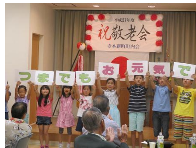
9名の敬老者の方々をお迎えして、ボランティアの腹話術や子供達のかわいい歌のプレゼントで楽しいひとときを過ごしていただきました。