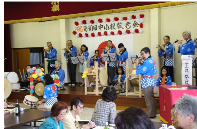
9月6日(日)雨にもかかわらず大勢の方に参加していただきました。祭囃子の演奏も恒例となりすっかり板についてきました。