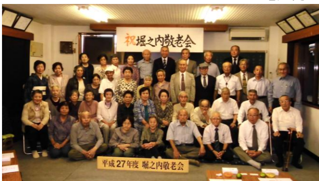
長寿を願って、「ハイチーズ」。