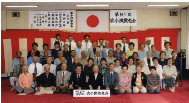
祝宴のカラオケ発表会では日頃の練習の成果からまだまだ元気な姿を拝見でき、続いてビンゴゲームでも大変盛り上がり好評でした。