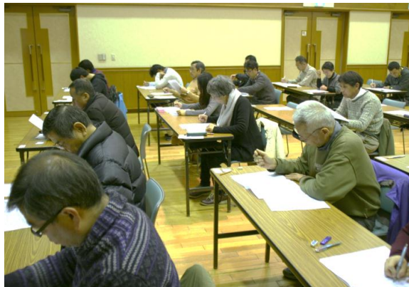
第2回ふるさと検定試験(H28-1-17)

申込方法 (1) 本頁最下欄の申込書に必要事項を記入して、お住まいの地域の組長・町内会長に提出(申込書のみ)してください。 (2) 後日、検定実行委員会から受験料・受験テキストなど受付手続きについてご連絡します。