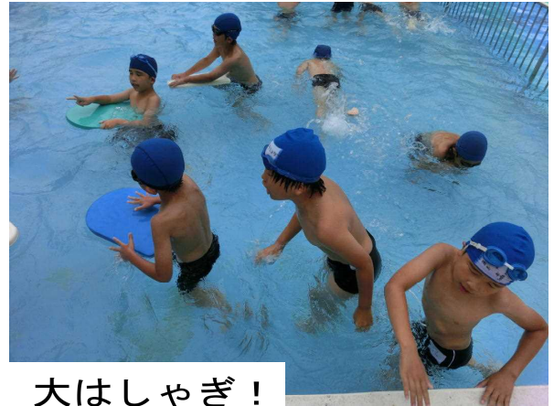
学習後の自由泳ぎに、大はしゃぎ！