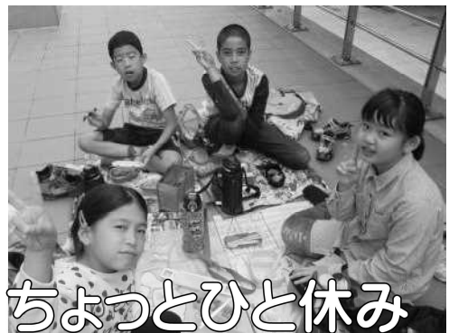
ちよつとひと休み