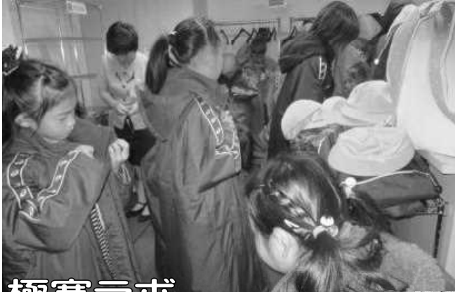
極寒ラボ きみはたえられるか？