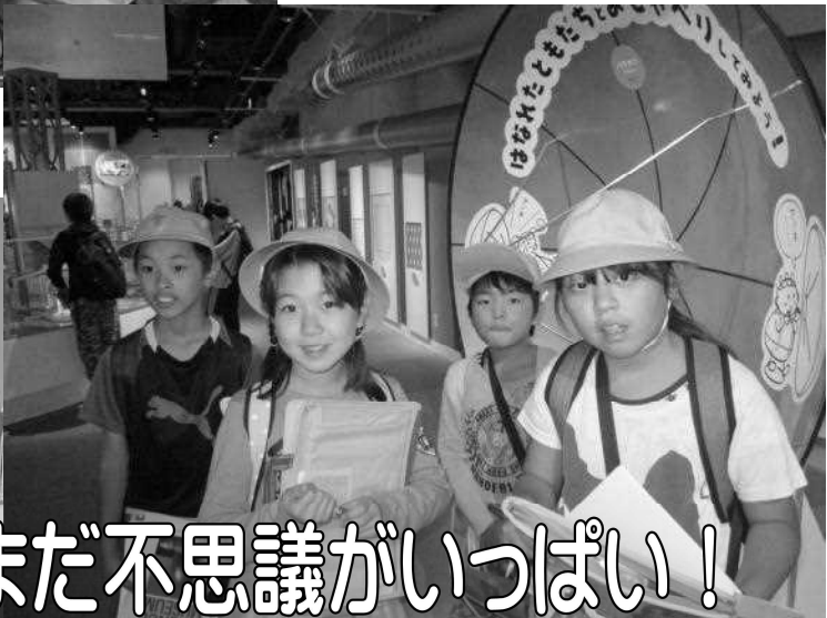
まだまだ不思議がいっぱい！