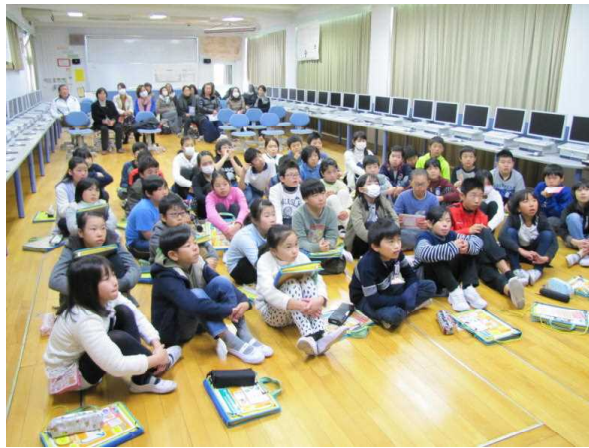
コンピュータールーム（会場）の様子