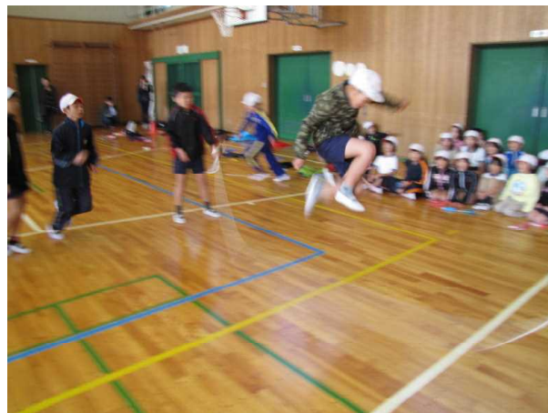
8の字跳び 白組男子