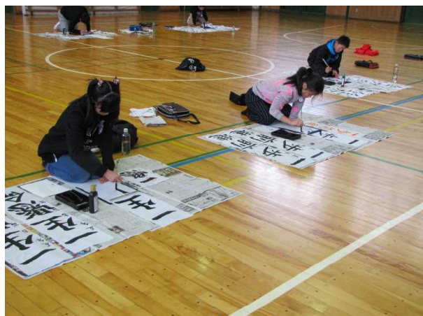
極寒の体育館で行いました。

1月11日に書き初めをしました。初めは、思うようにいかずに困っている子どもたちも見かけましたが、最後には満足のいくすばらしい作品が完成していました。また、静かに心を落ち着け、思いを込めて書き初めをすることができました。