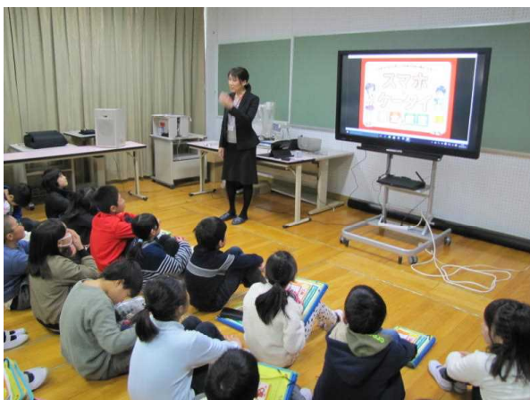
NTT ドコモ 講師の方のお話