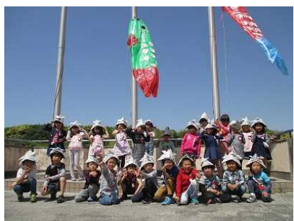
〈5月2日 1年生 こいのぼり集会〉