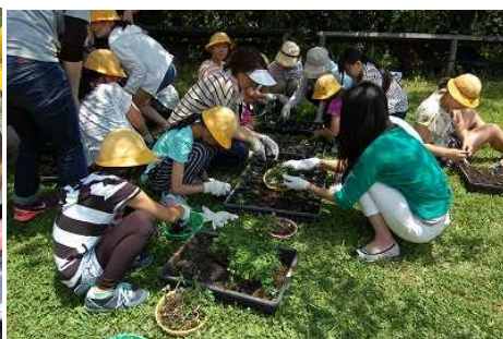
〈5月23日 5年生 グリーンスマイル活動〉