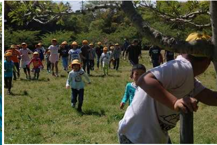
〈だるまさんが転んだ〉