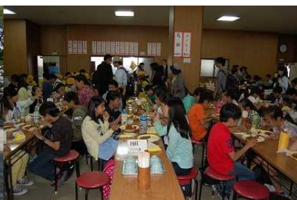
〈昼食の唐揚げカレーライス〉