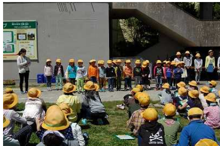
〈よろしくお願ひします!〉

4月28日(金)に、1年生を迎える会とフィールドビンゴを学校で行い、その後、ペア学級で旭公園までトロウォーキング(校外学習)に出かけました。1年生も元気良く参加でき、ペアで仲良く遊ぶ姿が見られました。