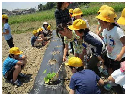
〈5月19日 1・2年生 ジャンボカボチャ苗植え〉