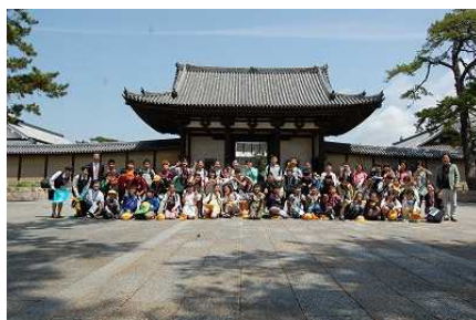
〈法隆寺に全員集合〉

5月11日(木)・12日(金)の2日間、6年生が奈良・京都方面に修学旅行に出かけました。法隆寺では、救世観音像を拝観でき、東大寺では、全員が柱の穴ぐりに挑戦できました。鹿苑では、係の方からドングリをたくさん用意していただき、鹿にえさをあげることができました。2日目の京都分散研修では、タクシーの運転手さんのきびきびとした態度にも感動しつつ、思い出に残る研修ができました。