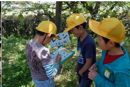
〈フィールドビンゴ〉