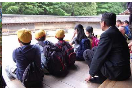
〈龍安寺石庭を見学〉