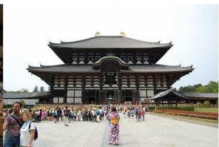
〈東大寺大仏殿にびっくり〉