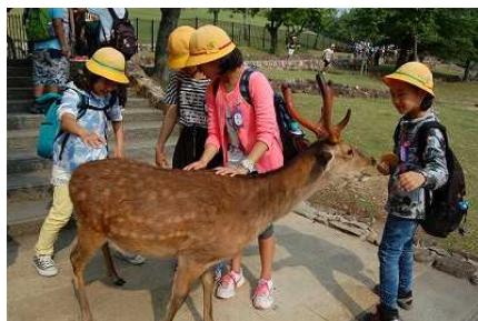
〈若草山で鹿と遊びました〉