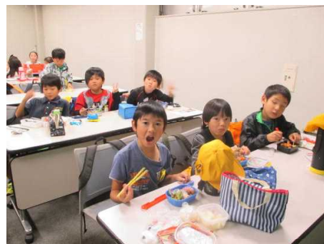
LIXIL見学 「お弁当 いただきます！」