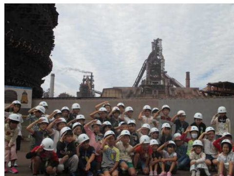
新日鐵住金見学 工場内でのあいさつ 「ご安全に！」