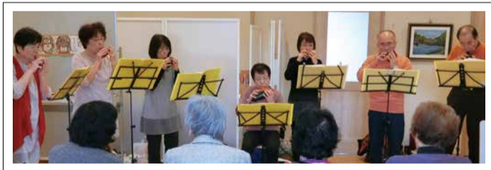
サロンでの演奏会

ナに対して、 熱い思いもあ り自分のオカ リナを県外の 工房まで出か けて購入され る方もいます。 代表は「今 後も、みんな が仲良く和気 あいあいと長 く続けたい」と語られまし た。