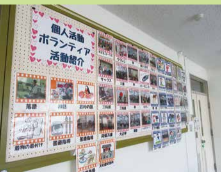
個人ボランティアの紹介

ギャラリーを設けています。年間5回 ほどボランティアグループの活動や社協 の情報を掲示しています。