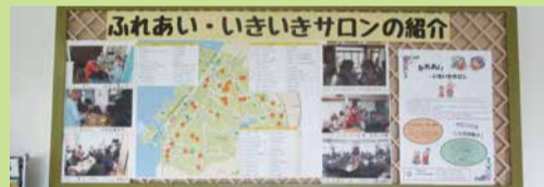
ふれあい・いきいきサロンの紹介