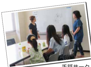
手話サークルにて