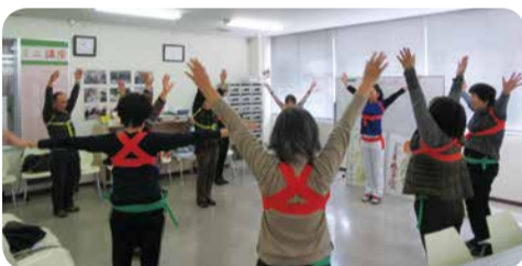
歪みとり体操でリフレッシュ

月に3回程度、ボランティアが講師になり活動の紹介をしています。楽しみ ながら、いろいろな講座に参加してみませんか？ 詳しくは広報ちたでお知らせします。