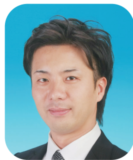
会員拡大特別委員会